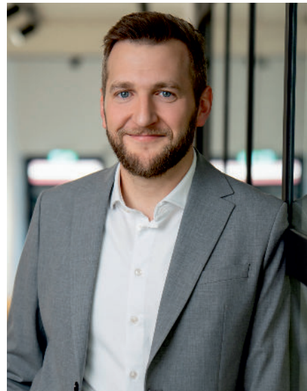
Geschäftsführer Betriebswirt / Immobilienkaufmann Sachverst. Immobilienbewertung (EIA / IHK)